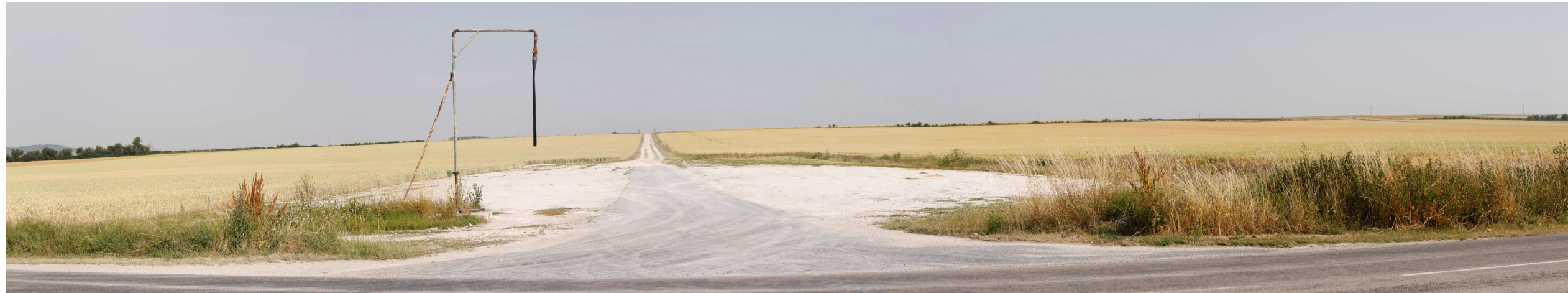
Le site actuel