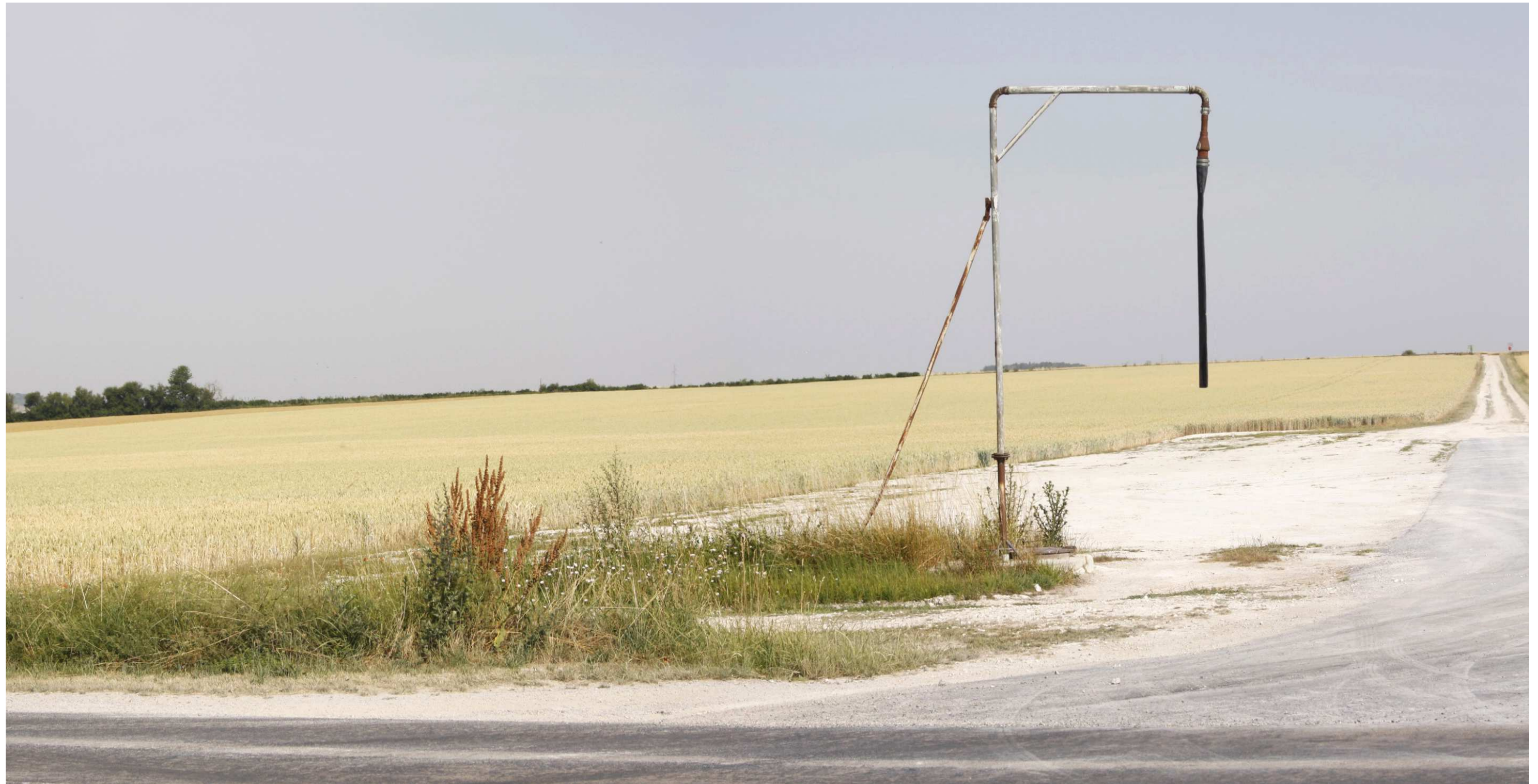
Le site actuel